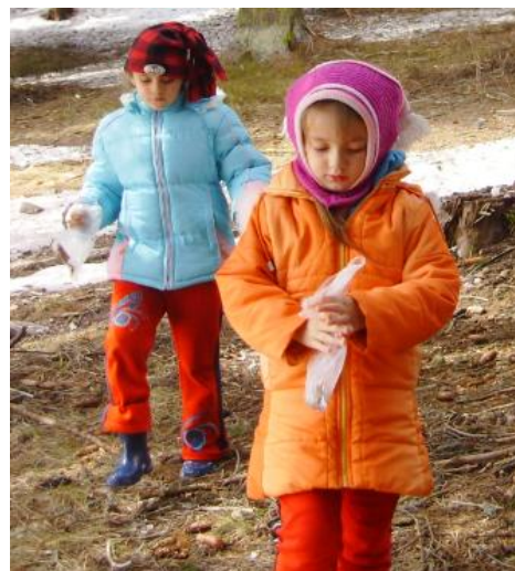
Gyűjtötték az erdő apró csodáit!

Az első éjszaka volt a legnehezebb. A gyerekek felszabadultak, nagyon jól érezték magukat és nem akartak elaludni. A következő napokat vers- és énektanulással, kézműves foglalkozással töltöttük. Volt részünk viharban, hidegben, hóban egyaránt. A zord időjárás ellenére nagy sétákat tettünk az erdőben. Élményeikről a