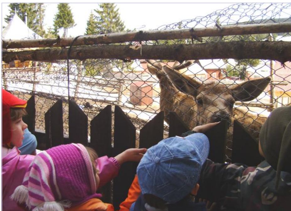
A gyerekek nagy érdeklődéssel, egészen közelről szemléltek az erdő lakóit.

gyerekek rajzban, valamint szóban számoltak be.