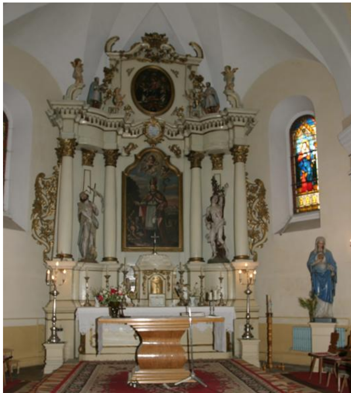
» A főoltárkép templomunk védőszentjét, Szent Lénárd püspököt ábrázolja.

Egyházi ünnepeink között jeles helyet foglal el november 6-a, Szent Lénárd napja. Az 1771 táján épült plébánia-templomunkat gróf Batthyányi Ignác gyulafehérvári püspök szentelte fel Szent Lénárd püspök tiszteletére.