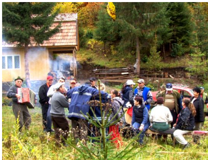
» Tízoltónap. Az erdei levegő, a báránytokány illata és a zeneszó megadta az ünnep hangulatát.