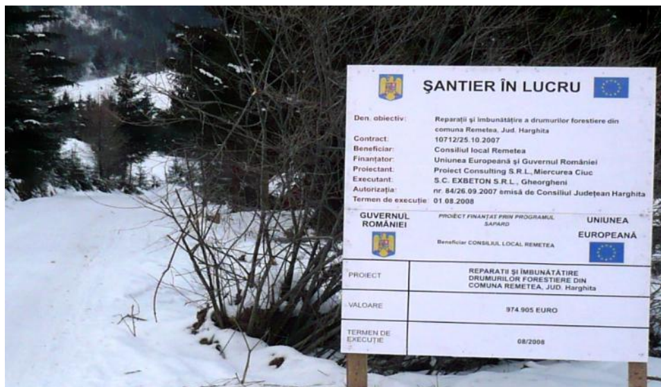
» Erdei út. A tavaly decemberben megkezdett útjavítás befejeződött, így jövő hónapban hivatalosan is átadják a 13,9 km útszakaszt.

A járható útnak köszönhetően jelentősen megnövekedett a forgalom, viszont az autózóknak szem előtt kell tartaniuk, hogy ez hegyi út és adott esetben balesetveszélyes lehet. Ezen az útszakaszon ugyanazok a közlekedési szabályok érvényesek, mint bármelyik más részen. Az esetleges balesetek elkerülése érdekében ajánla-