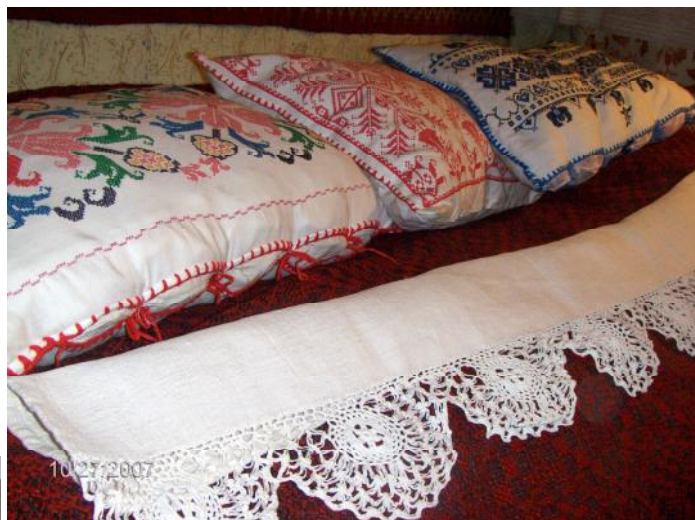
» A megvetett ágyakhoz rendszerint hozzátartozott a ráklábas csipke.