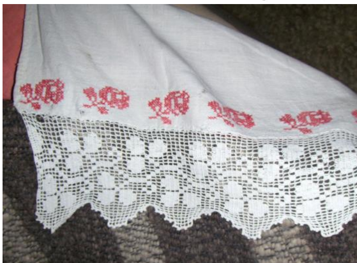
» Herelapis csipke A közel kétszáz éves lepedő Füstös Rozália tulajdona.