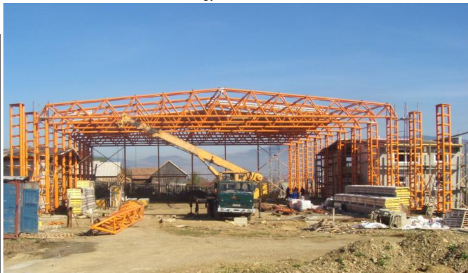
» Épül a sportszalon. A kormányprogramból finanszírozott 150 férőhelyes létesítmény jövő áprilisára készül el.

Jó dolog, hogy ezen a részen hétvégi házakat építenek, hiszen ez jelentősen megnöveli az érintett területek értékét, viszont ezen építkezések esetében is érvényesek a törvényes elírások, engedélyeztetések.