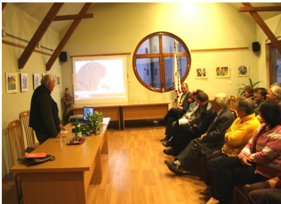
» Zenei anyanyelvünk. Kallós Zoltán gyűjtőútja során készített filmjének egyikével szemléltette az elmondottakat.

KALLÓS ZOLTÁN végezte a magyar nyelvterületen a legnagyobb népzenei gyűjtést. Gyűjtéseiből hanglemez válogatások jelentek meg, archív felvételeiből több hangzóanyag-sorozatot szerkesztett és adott ki. Énekesként maga is két lemezt jelentetett meg: Búsulni sohasem tudtam... , Idegen földre ne siess.... Néprajzi filmek szaktanácsadója, népzenei fesztiválok ünnepelt énekes, eladója. Az erdélyi és magyarországi táncmozgalom egyik életre hívója, népzenei és néptánc táborok szervezője. Nevelői hatása rendkívüli jelentőségű, mivel hosszú évek során fiatalok tömegeivel ismertette és szerettette meg a magyar népművészetet. www.kallos.org.ro