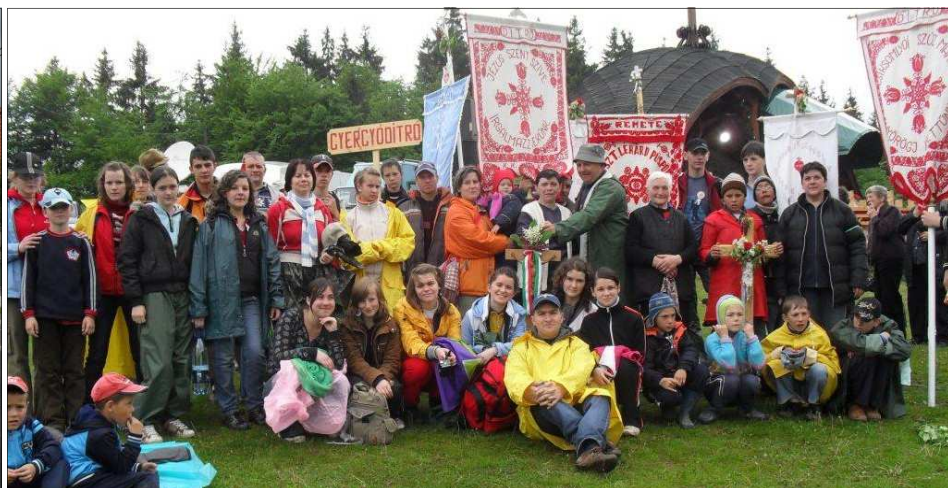
» Hosszú kihagyás után Remetéről idén ismét gyalogos zarándokcsoport indult a csíksomlyói búcsúra. Többségében fiatalokból állt a kereszta- lja