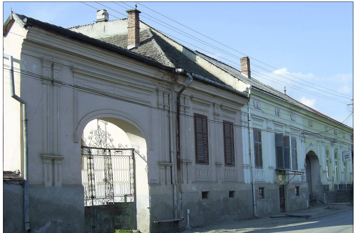
« Mélik-féle ház az eredeti kovácsolt vas kapujával a községközpont jellegzetes épülete.

A remeteiek emlékezetében a Mélikek, főleg id. Mélik István vagyonukat úgy szerezték meg, hogy az írni-olvasni nem, vagy alig tudó lakosokkal visszaéltek a hitelezések során (ital, tutajozáshoz prémonda stb). Ezt próbálta felnagyítani és a lakosság