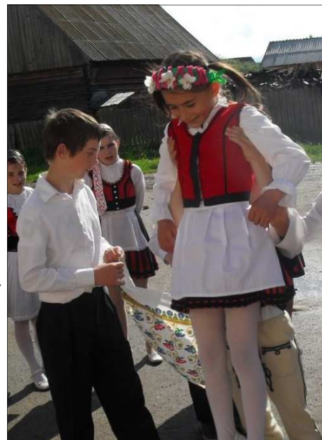
» A csutakfalvi pünkösdlő-játék bemutatóján