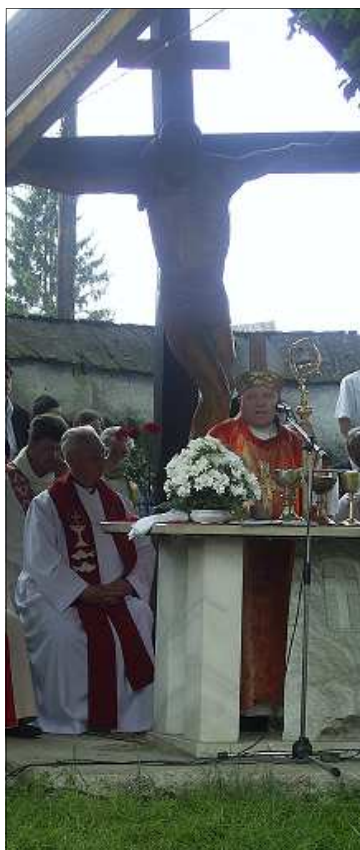
« Bérmálkozás egyházközségünkben